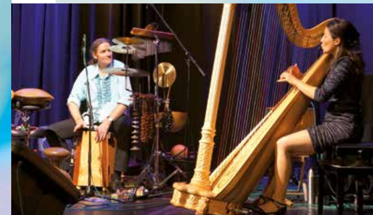
„poco piu“: Samstag, 30. 09. um 17.30 Uhr im Foyer der Kulturhalle Ober-Roden.

Mit ihrer Neugierde auf alles, was ihnen in ihrer Soundcloud begegnet, der Spielfreude und temperamentvollen Musik, ihrer virtuoson und intensiven musikalischen Kommunikation und der lockeren Moderation durch den Abend, machen sie alles richtig, um unvergessliche Momente zu bereiten.